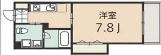
*写真は同タイプ他室のものです。 *反転タイプあり