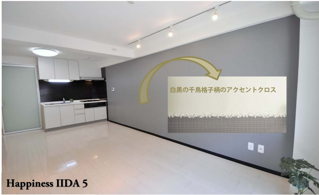
Happiness IIDA 5