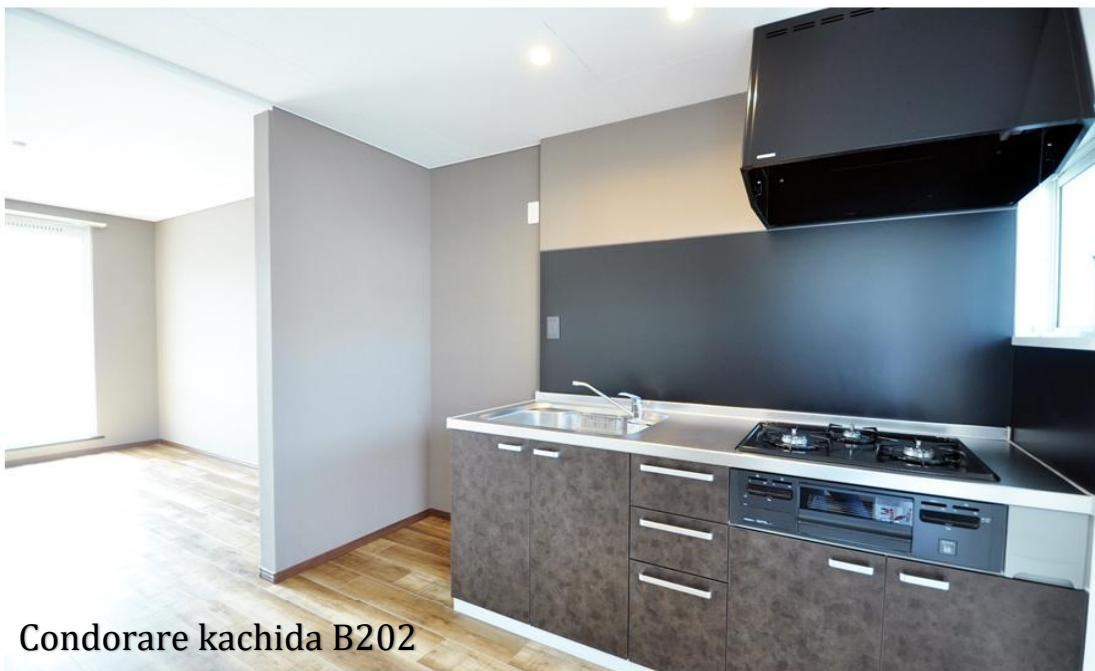
Condorare kachida B202