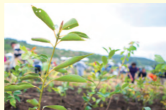
神奈川県「湘南国際村めぐりの森」